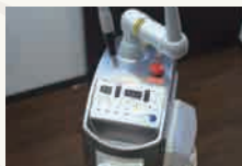
レーザー医療機器

3D画像で撮影可能な最新型のCTを導入。1回の放射線量が従来のCTと比べて非常に少ないため、患者さまへの負担の少ない治療が行えます。