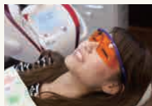
ホワイトニング機器

口内炎の治療や知覚過敏、傷の治療促進など、口腔内の様々なトラブルに使用いたします。